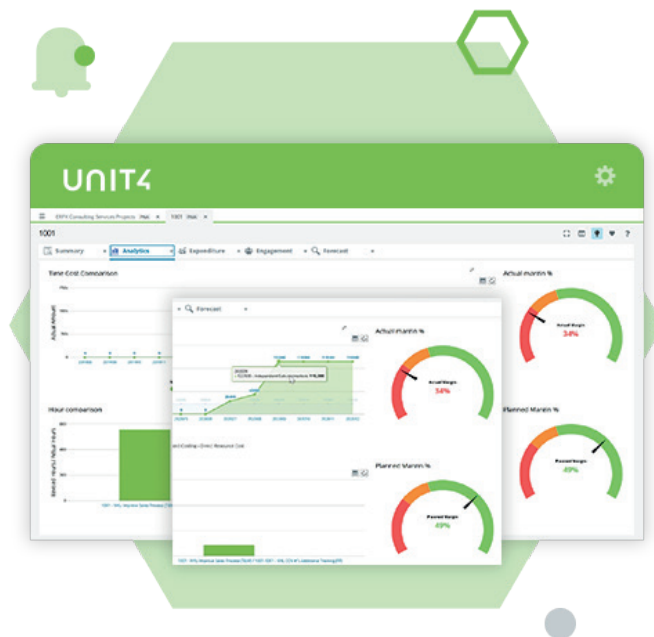
Unit4 ERP Project exemple d'écran

Les projets peuvent aller de petits projets internes à de grands contrats complexes qui peuvent concerner plusieurs entités juridiques, générant des contributions significatives au chiffre d'affaires et à la rentabilité des opérations, impliquant un grand nombre de ressources et entraînant des coûts élevés.